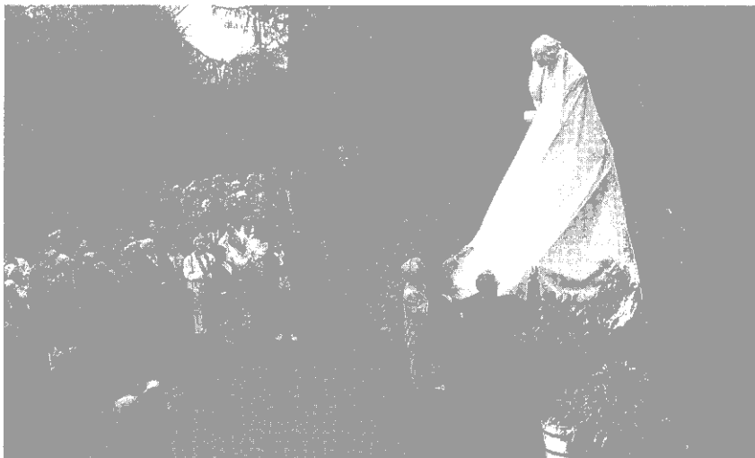
Abb. 1. Enthüllung des Shakespeare-Denkmal 1999

Jedes Jahr, gegen Ende April, findet in Weimar ein ungewöhnlicher Morgenspaziergang statt, zum Shakespeare-Denkmal im Park an der Ilm. 1 Seit 1999, rechtzeitig zum Jahr Weimars als europäische Kulturhauptstadt, erstrahlt es wieder in hellem Weiß (Abb.1). Vier Jahre zuvor war der Spaziergang noch etwas ungewöhnlicher gewesen. Am Rand des Stadtparks setzte sich die gleiche Prozession in Bewegung; aber ihr Ziel war der leere Sockel des Denkmals. Es war entfernt worden, um restauriert, um von den Wunden einer mehr als neunzigjährigen Geschichte der Verwitterung, der Umweltverschmutzung, der Verlegungen und des Vandalismus geheilt zu werden. [Ende S. 146]