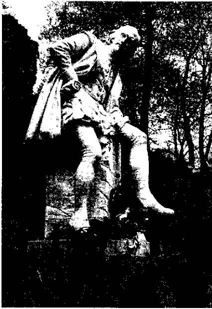
Abb. 2. Das Shakespeare-Denkmal nach dem Rosenzeremoniell