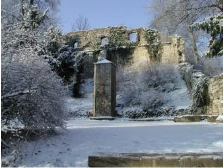
Das Denkmal im Winter (2002)