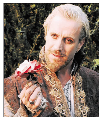
So sieht ein Genie aus: Rhys Ifans als Graf Oxford.

Der erst blondierte, dann ergraute Rhys Ifans spielt den rei-