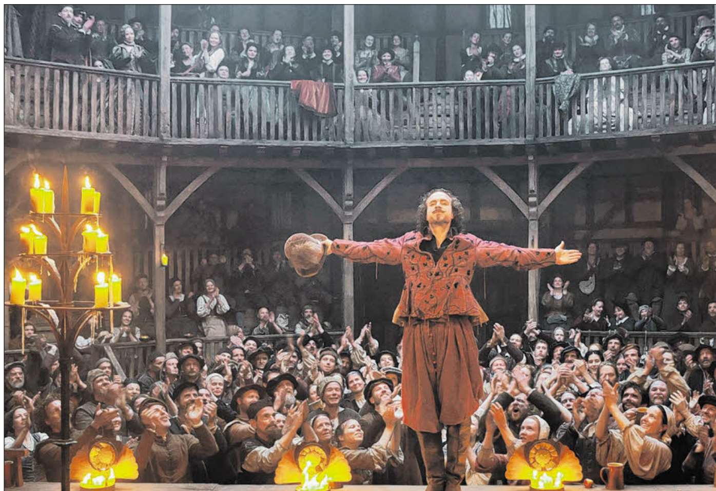
Große Schmierkomödie: Der Schauspieler Shakespeare (Rafe Spall) verkörpert als Dichter die Rolle seines Lebens.